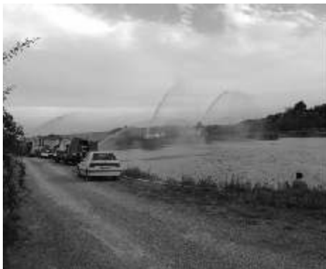
Zavzdušňování Kovalovického rybníku.

Na závěr by vám všem sbor dobrovolných hasičů touto cestou také rád poděkoval za přízeň i za dodržování protipožární prevence (např. každoroční provádění kontroly a čištění spalinových cest vyplývající ze zákona o požární ochraně) a popřál do nadcházejícího roku 2019 především pevné zdraví, štěstí a mnoho osobních i pracovních úspěchů.