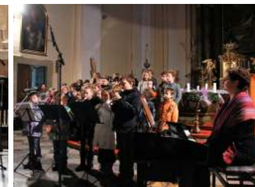
Adventní koncert v kostele Nanebevzetí Panny Marie