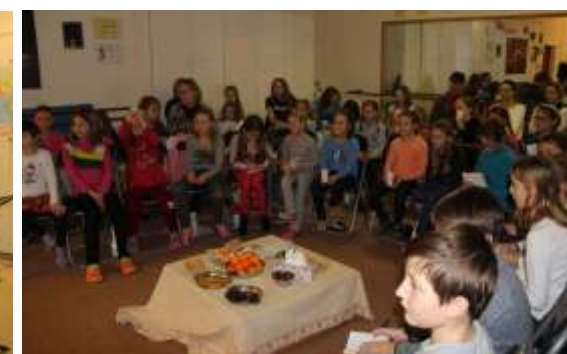
Mikulášské povídání o tanci