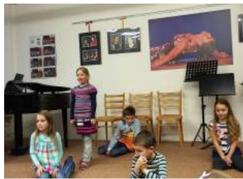
Společný program pro rodiče