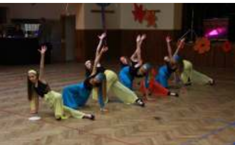
Taneční vystoupení na Sokolských šibřinkách