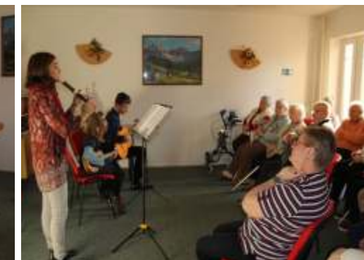
Vystoupení v Domě s pečovatelskou službou