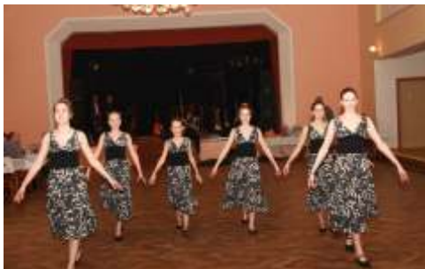
Taneční vystoupení na Netradičním plese