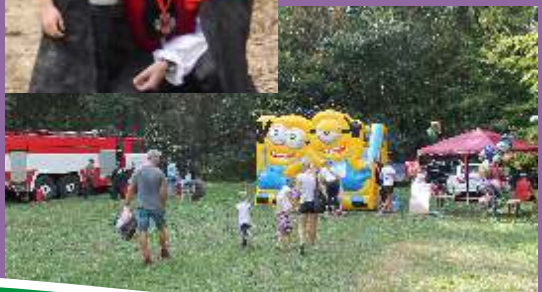
Obchod fy Jos. Bezloja