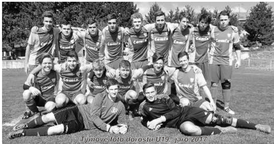
Týmové foto dorostu U19, jaro 2017.

udržet a zasloužit se tak o historický úspěch pozořického dorostu. Pevně věříme, že se jim to i s vaší fanouškovskou podporou podaří.