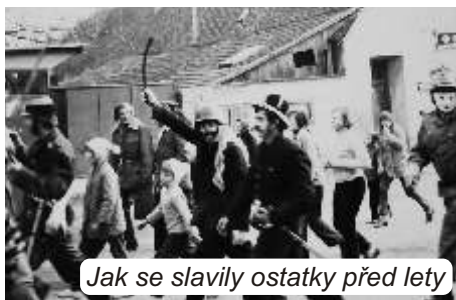
Jak se slavily ostatky před lety

V neděli 26. února naplnil ulice Pozořic veselý smích, vřeštění, ryčná muzika a pestré kostýmy maškarád. Po více než 40 letech vyšel z Axmanovy hájovny na Jezerách ostatkový průvod. Na počátku cesty masky našlapovaly nejistě, přece jen jejich kroky vedly cestou tradice, která byla v Pozořicích již téměř zapomenuta. O tom, jak se slavily ostatky před lety, nám s chutí vyprávěli