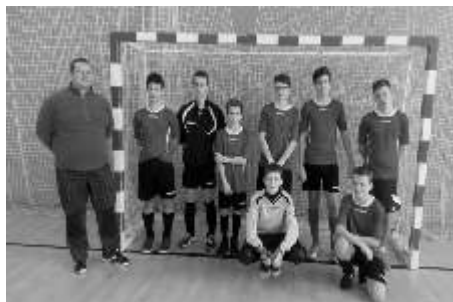
Foto z turnaje žáků Střelice 7. 1. 2017, 4. místo.

Další věkovou kategorií jsou žáci U15 , kteří po podzimní části soutěže skončili v tabulce na pátém místě s třemi výhrami a pěti porážkami. Slovy trenéra je největším problémem vstřelit gól z vyložených šancí. Kluci o tomto problému vědí a snaží se s tím něco udělat. Na trénincích si dobrovolně přidávají a pilují střelbu. Doufejme, že tento pozitivní přístup přinese kýžené ovoce. Během zimní přestávky se mužstvo žáků zúčastnilo halových turnajů v Křenovicích a Střelcích, kde jsme obsadili 4. a 5. místo.