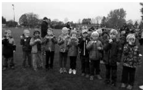
Foto z turnaje minipřípravek U7 Tuřany 26. 4. 2017, 4. místo.

Během zimní přestávky absolvovala všechna naše mužstva přípravek zimní halové turnaje, ve kterých sbírala s kvalitními soupeři cenné zkušenosti. Tréninky během zimní přestávky probíhaly v tělocvičnách místních ZŠ (Pozořice a Sivice).